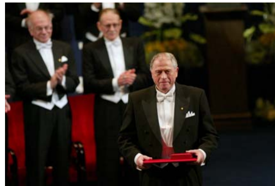
Kurt Wüthrich mit Nobelpreis

Kurt Wüthrich misst der frühen Unterstützung durch den SNF heute noch viel Wert bei. «Ohne die Nationalfonds-Beiträge hätte ich die von der ETH finanzierte Infrastruktur, in erster Linie die NMR-Spektrometer, nicht erfolgreich einsetzen können.» Doch die Bedeutung reicht über die blossе finanzielle Seite weit hinaus, wie der derzeit in Kalifornien arbeitende Nobelpreisträger verrät: «Psychologisch war es immer ein gutes Gefühl, als „SNF-Forscher“ zur Schweizer Wissenschaftsgesellschaft zu gehören.»