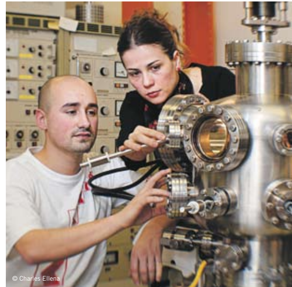
Wichtig ist dem SNF der gleichberechtigte Zugang von Frauen und Männern zu seinen Förderungsmitteln.

Nach wie vor sind Frauen in höheren akademischen Positionen untervertreten, so liegt der Professorinnenanteil in der Schweiz gegenwärtig bei 14%. Der SNF unternimmt deshalb aktiv Anstrengungen, die gleichberechtigte und ausgewogene Teilhabe von Frauen und Männern in seinen Gremien und Instrumenten zu fördern. Insbesondere ist er bestrebt, den Anteil der Frauen in Führungspositionen zu erhöhen. Ein wichtiges Anliegen ist dem SNF der gleichberechtigte Zugang von Frauen und Männern zu den Förderungsmitteln, immer vor dem –Hin-