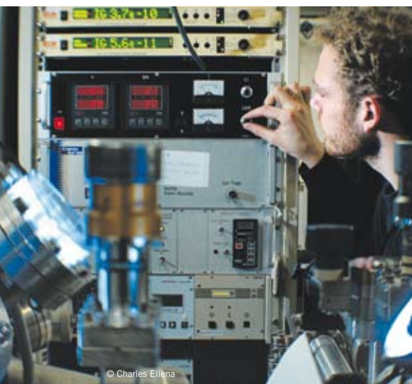
Rund 5500 junge, talentierte Forschende hat der SNF 2007 im Rahmen der freien Forschung unterstützt.

› Der SNF hat 2007 Forschungsprojekte und Nachwuchsforschende mit insgesamt 531 Mio. Franken unterstützt. Besonders erfreulich für die Forschenden: Die Erfolgsquote ist trotz Rekordeingang angestiegen. In der Projektförderung der freien Forschung lag sie bei rund 50%.