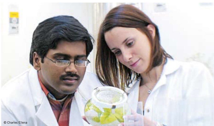
Internationale Forschungszusammenarbeit im Rahmen des 2001 gestarteten NFS «Plant Survival».

Die Ausschreibung erfolgt ohne thematische Vorgaben. Die Vorschläge müssen jedoch eine ausreichende thematische und disziplinäre Breite aufweisen, um die langfristige Förderung im Rahmen eines NFS zu rechtfertigen. Die Ausschreibungsmodalitäten werden weitgehend jenen der bisherigen Ausschreibungen entsprechen. Den Hochschulleitungen wird wiederum eine wichtige Rolle zukommen. Der SNF erwartet, dass jeder Skizze ein Unterstützungsschreiben einer Heiminstitution beiliegt. Als wichtigste Neuerung wird der SNF künftig auch Anträge akzeptieren, die von zwei oder maximal drei Heiminstitutionen gemeinsam getragen werden. Voraussetzung ist allerdings, dass eine