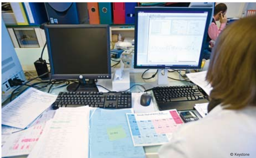
Wissenschaftliches Fehlverhalten wie Datenmanipulation oder Plagiate schadet der Forschungsgemeinschaft in hohem Masse und muss konsequent geahndet werden.

Mit schlanken Strukturen und geringem Verwaltungsaufwand qualitativ hochstehende Forschung zu fördern, setzt voraus, dass der Selbstkontrolle der Forschungsgemeinschaft grundsätzlich vertraut werden kann. Der SNF ist insbesondere auch darauf angewiesen, dass die Hochschulen bei der Ausbildung des wissenschaftlichen Nachwuchses ihre Verantwortung wahrnehmen. Die meis-