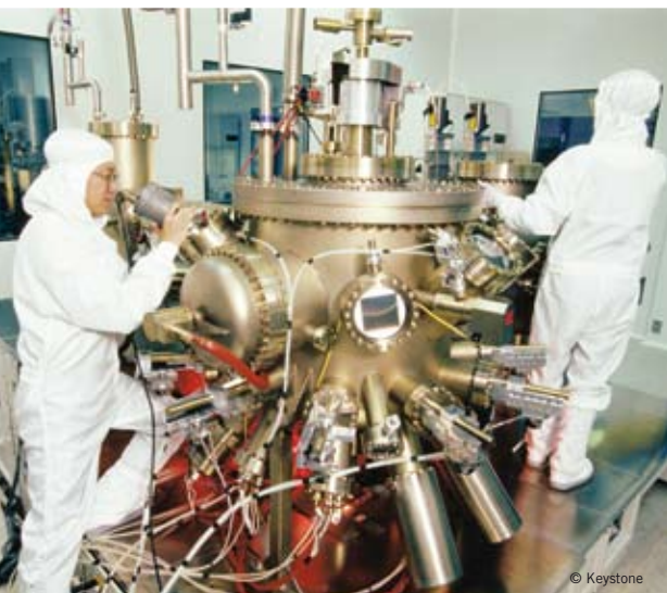
Neun Gesuche für neue Nationale Forschungsschwerpunkte stammen aus den Natur- und Ingenieurwissenschaften.

› Das Interesse an neuen Nationalen Forschungsschwerpunkten (NFS) ist beträchtlich. Nicht weniger als 28 Gesuche sind für die dritte Staffel beim SNF eingereicht worden. Internationale Gutachtergruppen prüfen nun die Vorschläge. Die Schlussauswahl nimmt das Eidg. Departement des Innern (EDI) 2010 vor.