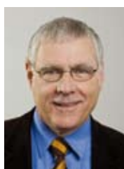
Dieter Imboden Präsident des Nationalen Forschungsrats des SNF

Die Schweizer Bevölkerung stimmt voraussichtlich am 7. März 2010 über einen neuen Verfassungsartikel ab. Dieser überträgt dem Bund die Kompetenz zur Gesetzgebung im Bereich der Forschung am Menschen und enthält Grundsätze zum Schutz der Würde und der Persönlichkeit der beteiligten Personen. Auch wenn die Umsetzung in konkrete rechtliche Bestimmungen weitgehend erst auf Gesetzesebene erfolgen wird, sieht der SNF gute Gründe für die Forschenden, um hinter dem Verfassungsartikel zur Forschung am Menschen zu stehen.