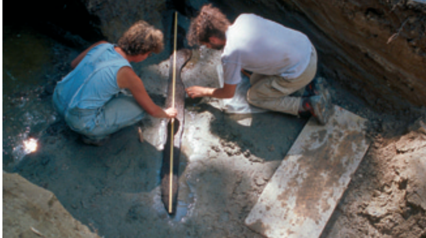
Laténium (2), Musée Schwab (1)

Questions et réponses sont tirées du site du FNS www.gene-abc.ch qui informe de manière divertissante sur la génétique et la technologie génétique.