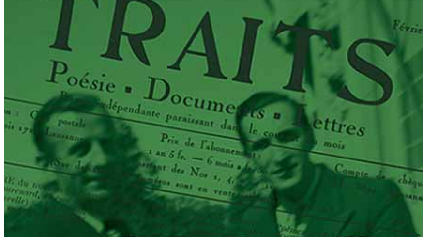
Musée historique de Lausanne, Mémorial de la Shoah

Questions et réponses sont tirées du site du FNS www.gene-abc.ch qui informe de manière divertissante sur la génétique et la technologie génétique.