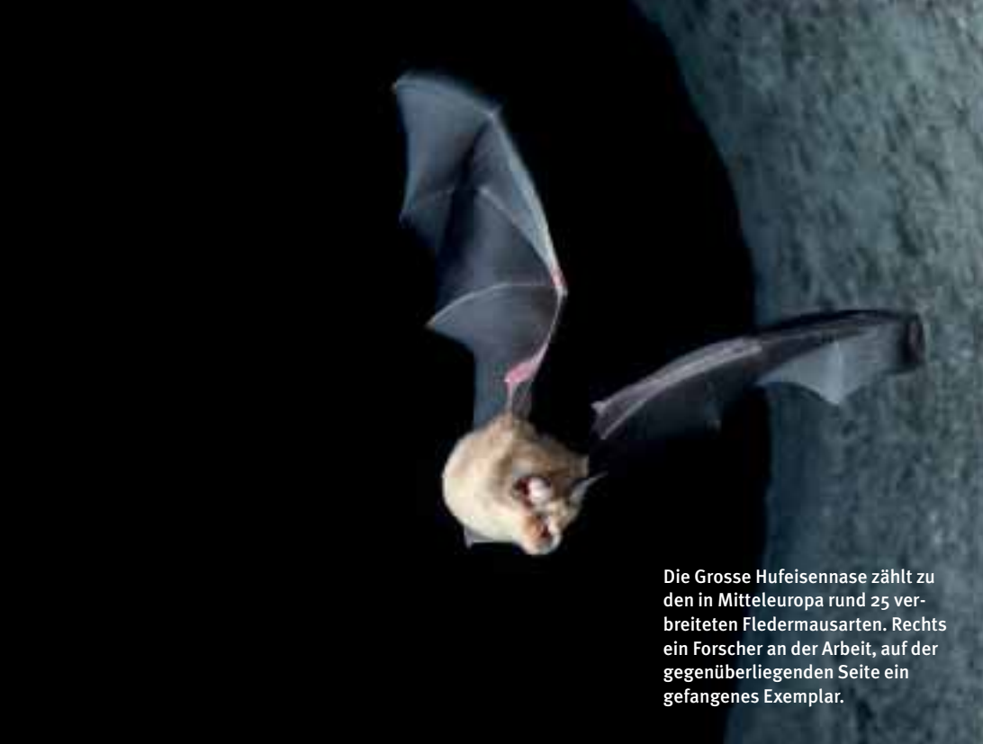
Die Grosse Hufeisennase zählt zu den in Mitteleuropa rund 25 verbreiteten Fledermausarten. Rechts ein Forscher an der Arbeit, auf der gegenüberliegenden Seite ein gefangenes Exemplar.