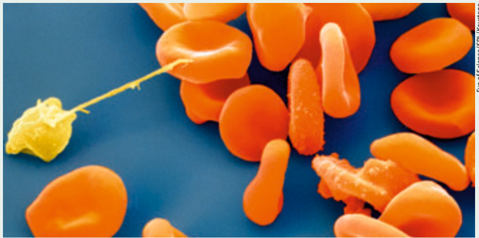
Attaque de malaria observée au microscope électronique à balayage. Le parasite plasmodium (en jaune) détruit les globules rouges.

Ce complexe joue aussi un rôle dans l'import des protéines et semble également participer à la réplication de la substance héréditaire de la mitochondrie. Etant donné que la cellule dose avec exactitude les substances dont dépend son pourvoyeur d'énergie, elle gouverne l'activité et la croissance de ce dernier. Benoît Kormann compare le complexe qu'il a identifié avec le câble arrimé à la nuque qui, dans « Matrix », alimente les hommes en nourriture matérielle et spirituelle: « Parfois la science ressemble à de la science-fiction. » ori ■