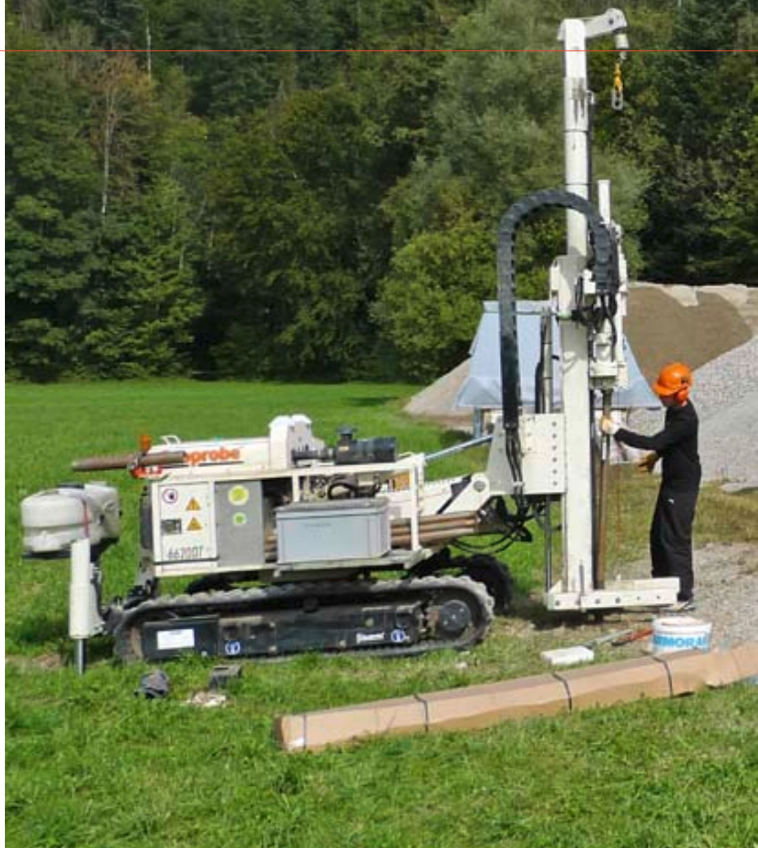
Forage et installation d'une sonde dans l'Emmental.