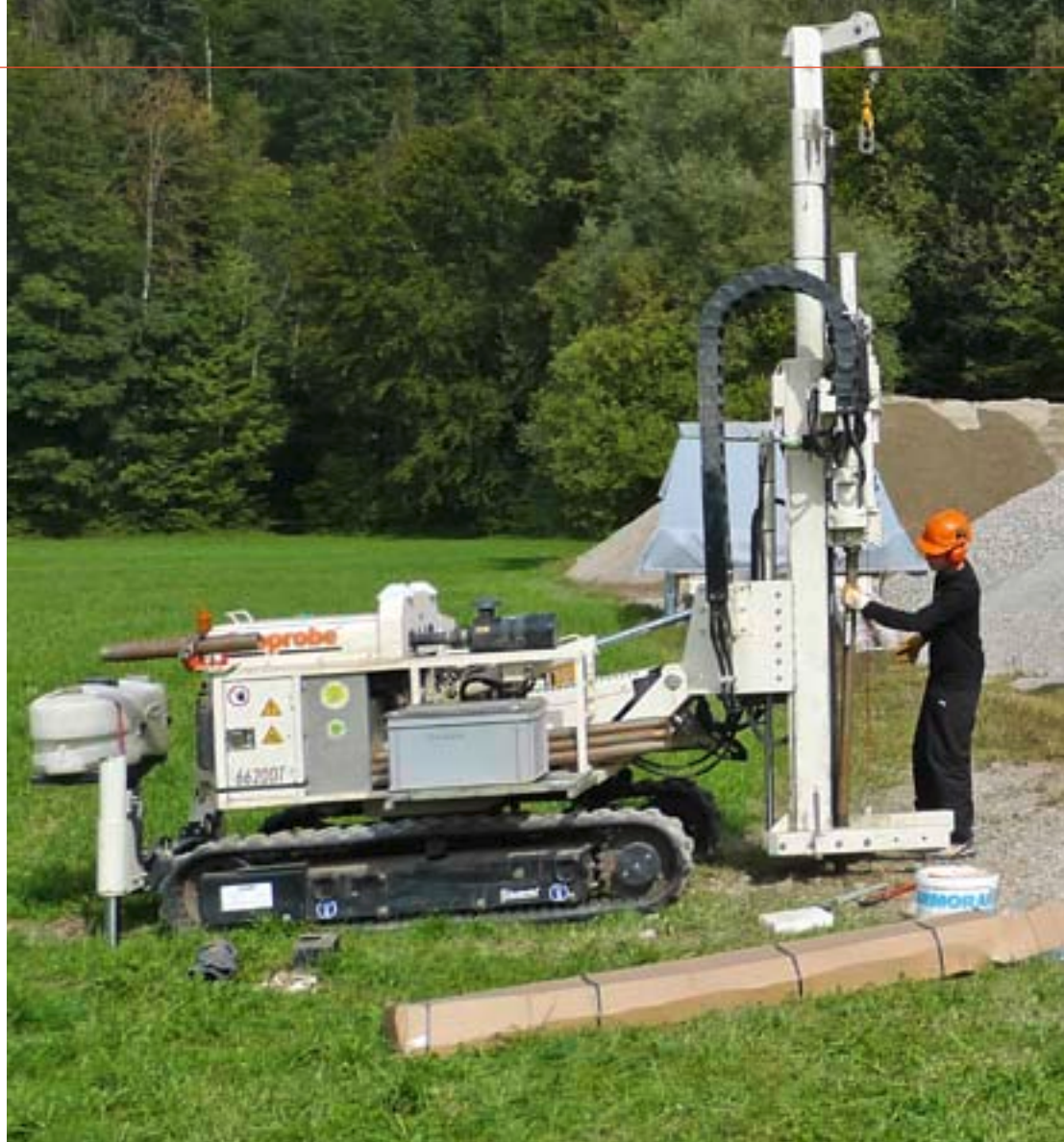
Bohren fürs Grundwasser: Installation einer Drucksonde im Emmental.

Aktuelle Klimaprognosen gehen davon aus, dass es in der Schweiz wärmer wird. Im Sommer werden weniger, im Winter dagegen mehr Niederschläge fallen. «In 100 Jahren könnte ein Sommer, wie wir ihn im Jahr 2003 hatten, die Regel sein und