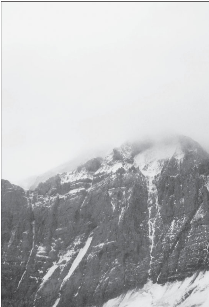
Glacier 5, 2005, photo unique, impression par jet d'encre sur papier Hahnemühle ou japon, 96 x 140 cm

les exposés des chercheuses et chercheurs auprès de groupes cibles pertinents, des colloques et conférences réalisés par les chercheuses et chercheurs, et des contributions à des revues et ouvrages scientifiques ainsi qu'à des publications écrites ou électroniques grand public. Afin d'optimiser la diffusion des résultats, les scientifiques ont établi, dès le début de leurs travaux il y a trois ans, des groupes d'accompagnement qui assurent les échanges avec la pratique.